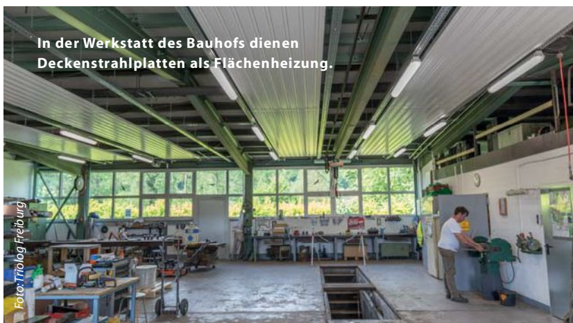
In der Werkstatt des Bauhofs dienen Deckenstrahlplatten als Flächenheizung.