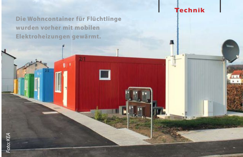
Die Wohncontainer für Flüchtlinge wurden vorher mit mobilen Elektroheizungen gewärmt.