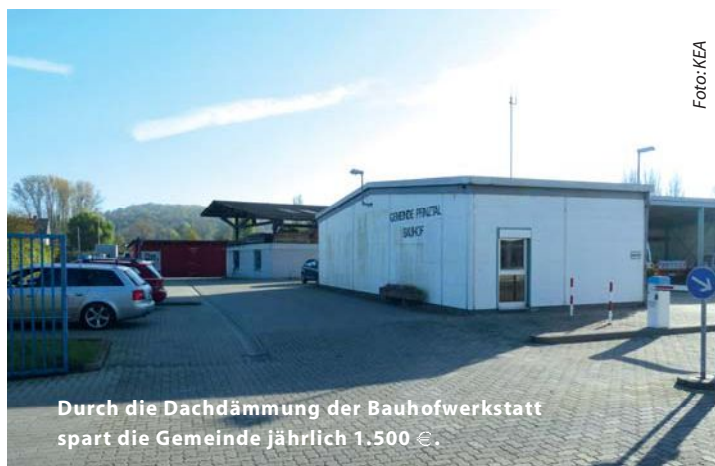
Durch die Dachdämmung der Bauhofwerkstatt spart die Gemeinde jährlich 1.500 €.