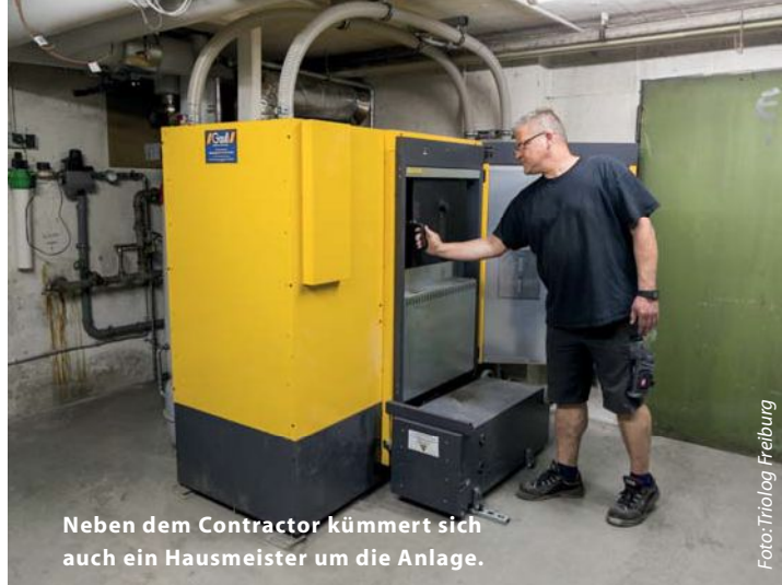
Neben dem Contractor kümmert sich auch ein Hausmeister um die Anlage.